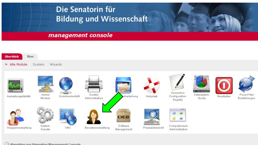
Abbildung 1 - Lehrerkonsole