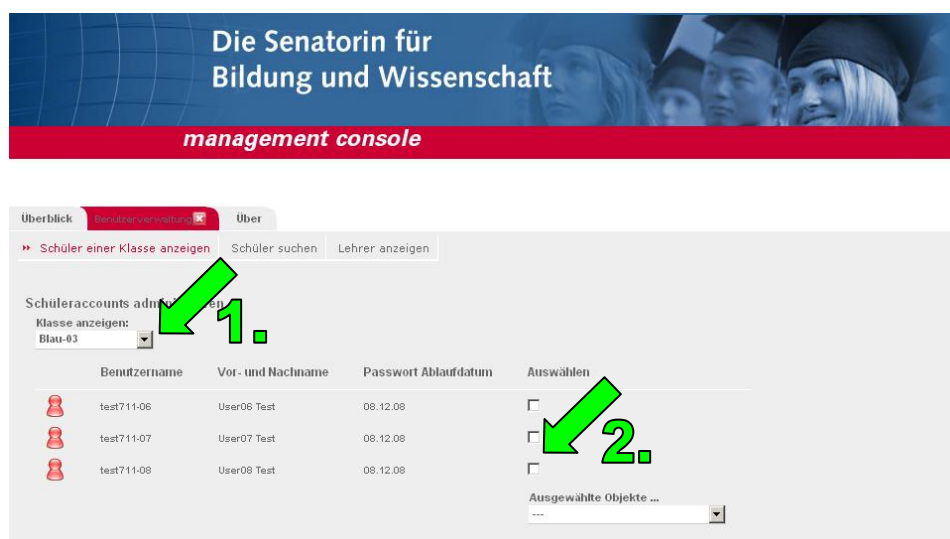
Abbildung 2 - Klassenliste

Nach Anklicken einer Klasse im Auswahlfeld Klasse anzeigen werden Ihnen alle Benutzerkonten dieser Klasse angezeigt (Abbildung 2).